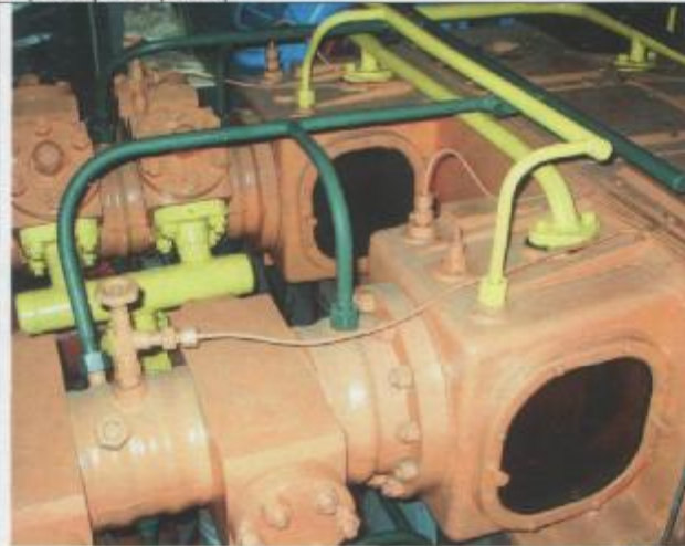
Фото 7: Элементы компрессора (проставка, уплотнения)