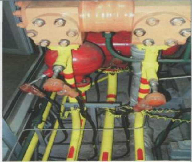
Фото 10: Система межступенчатого охлаждения газа