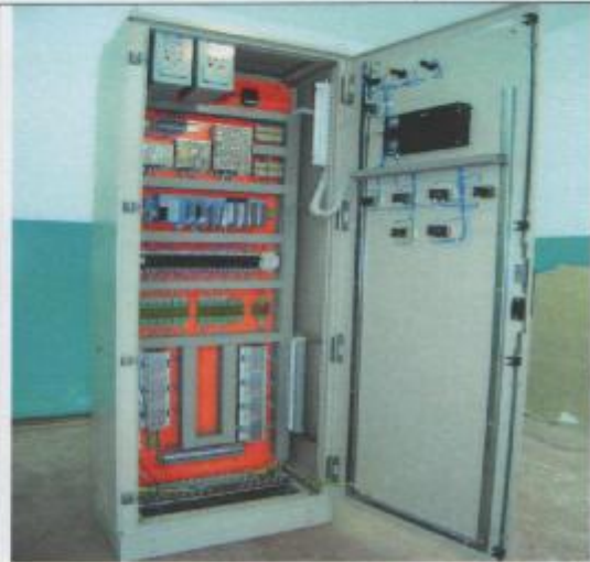
Фото 14: Шкаф управления