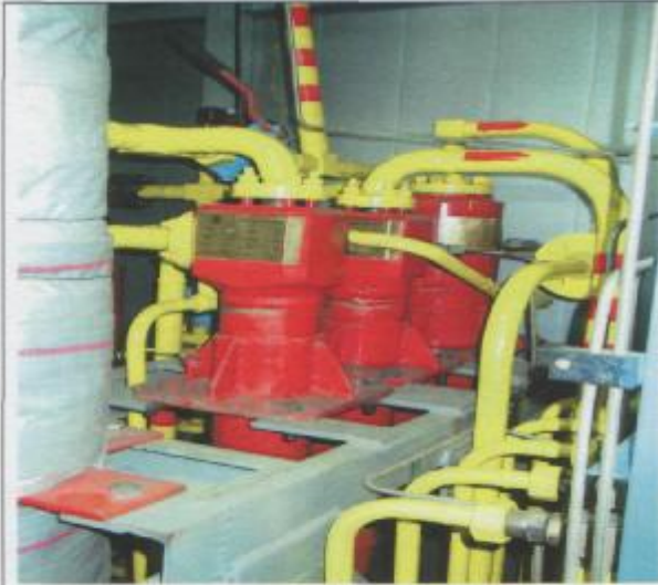
Фото 9: Система межступенчатого влагослоотделения