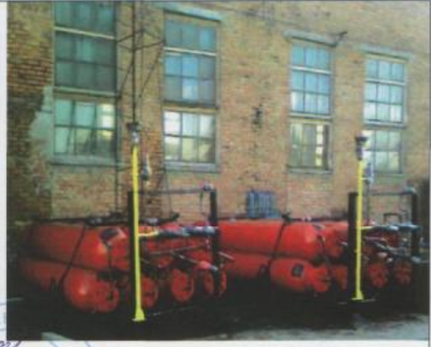
Фото 18: Компенсатор давления КД-2,8 (V-2,8 м³)