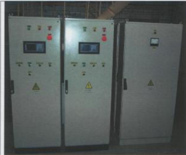
Фото 13: Шкафы управления и электрический