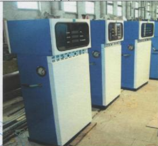
Фото 16: Колонки заправочные