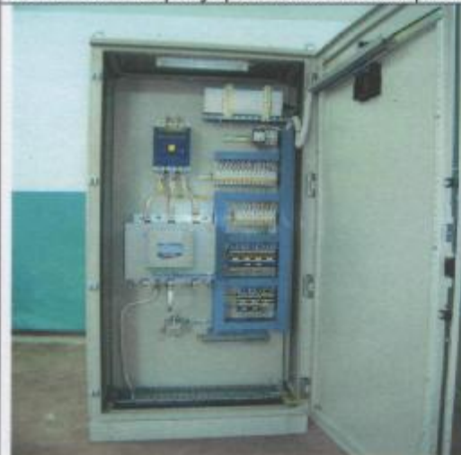
Фото 15: Шкаф электрический