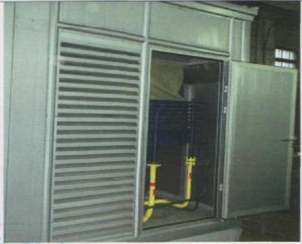
Фото 12: Система охлаждения и осушки газа