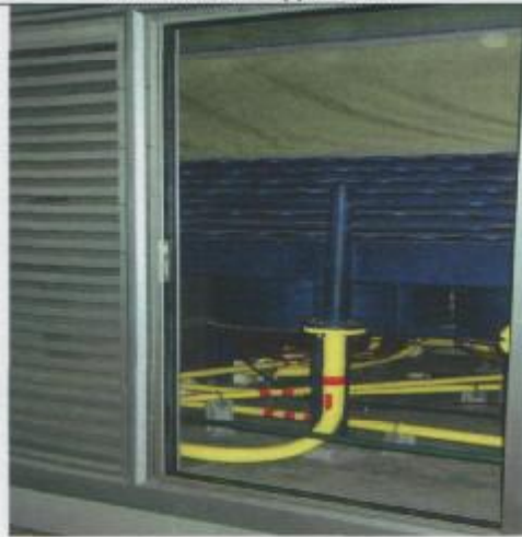
Фото 11: Система охлаждения и осушки газа