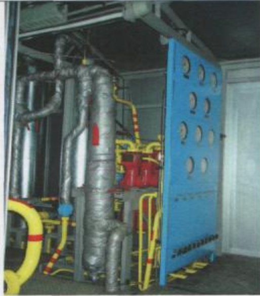
Фото 6: Система межступенчатого влагонмаслоотделения