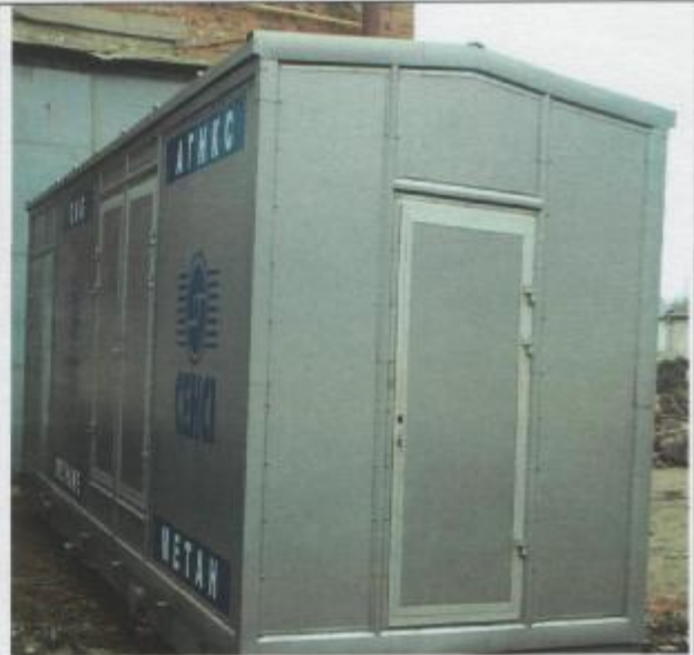
Фото 1: Установка Компрессорная Блочная (УКБ)