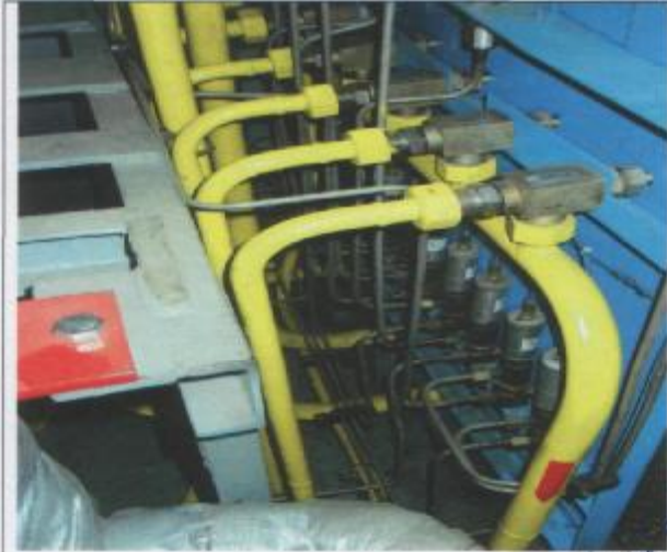
Фото 17: Разводка проводок КИП